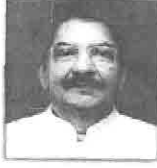
राज्यपाल, महाराष्ट्र राज्य