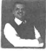
मुख्यमंत्री, महाराष्ट्र राज्य