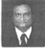
संचालक विजापत्र, इमाव व विमात्र कल्याण, महाराष्ट्र राज्य, पुणे